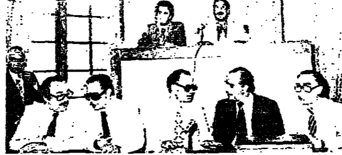
رئاسة المجلس والحكومة أثناء الجلسة